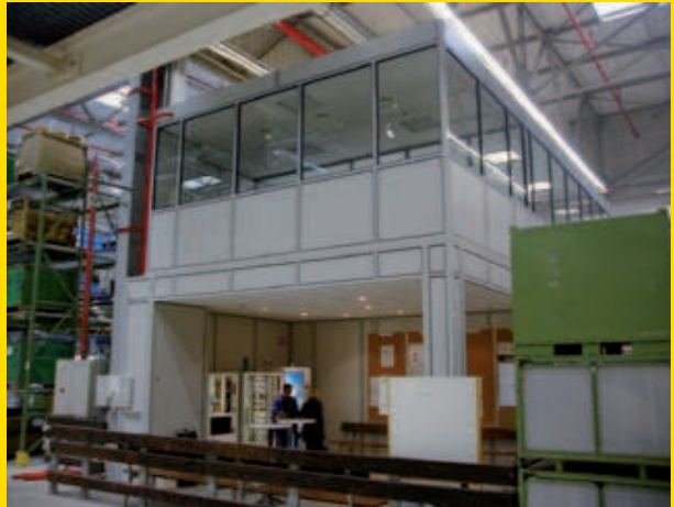
Ensemble intégrant réfectoire, salle de pose, archivage, coin repas, et local technique