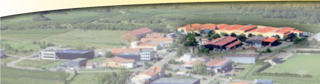
Usine de production - Barr

L'entreprise ECHAMAT-KERNST s'est implantée dans l'Est de la France (Fegersheim) en 1876. Sa longue expérience et sa parfaite connaissance du marché font d'ECHAMAT-KERNST un acteur incontournable en matière de fabrication, location et vente de matériel d'agencement, d'accès et de travaux en hauteur utilisés dans le bâtiment et l'industrie.