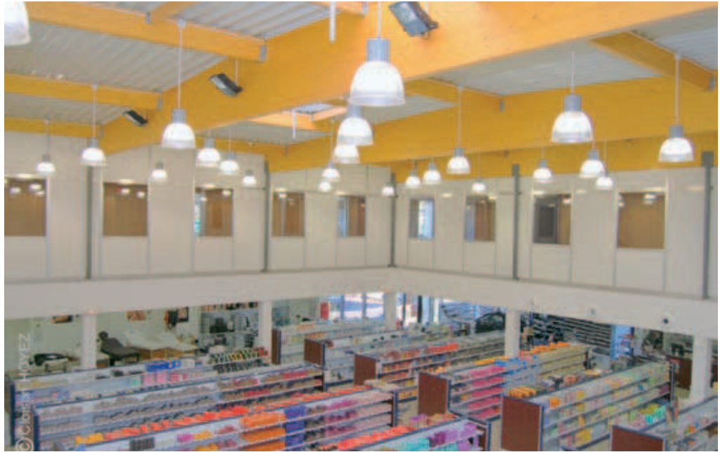
Cloisons pour réalisations de "salles grises" hors poussière.