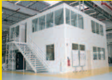
Bureaux sur 2 niveaux.