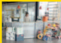
Vente comptoir Saint-Pierre