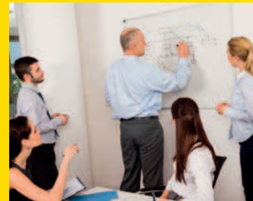
Formation accès en hauteur