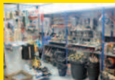
Vente comptoir Fegersheim

L'expérience et le savoir-faire du Groupe FORTAL auquel appartient ECHAMAT-KERNST permettent de vous proposer un service sur-mesure associé à la puissance et à l'expertise d'un fabricant français.