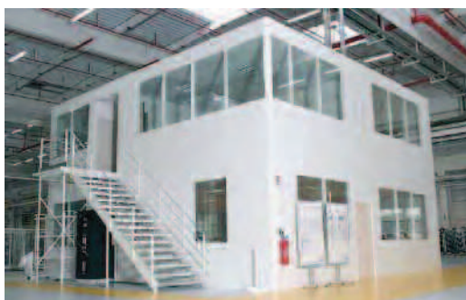
▲ Bureaux sur 2 niveaux.

Ensemble intégrant réfectoire, salle de pose, archivage, coin repas, et local technique