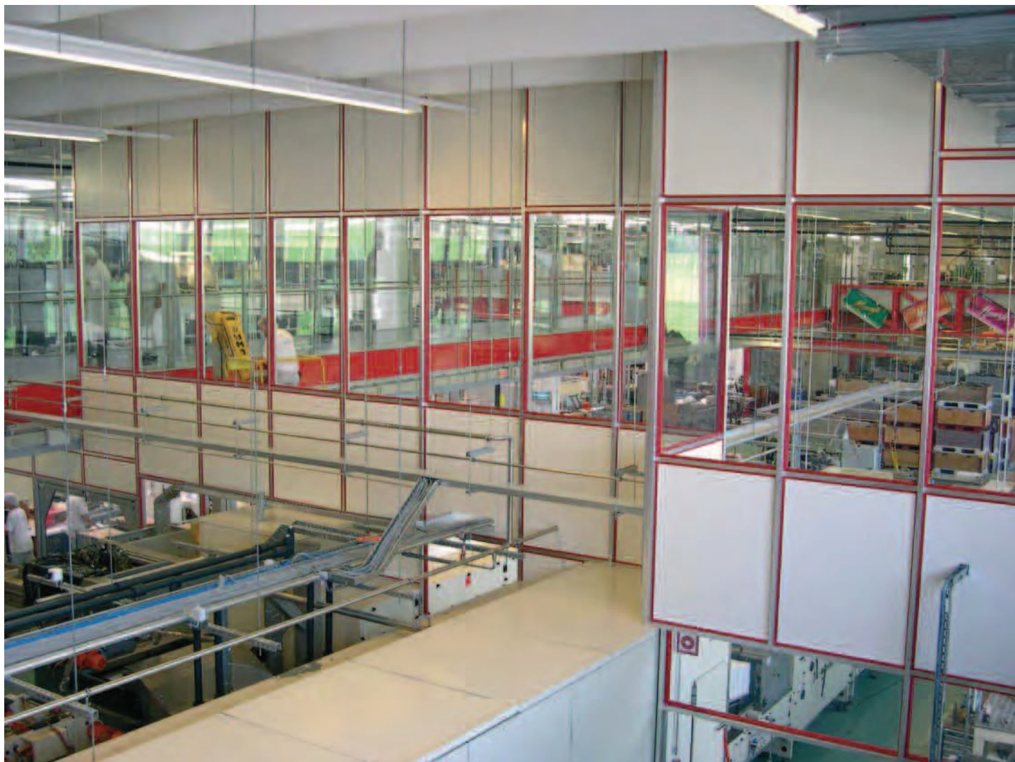
▲ Cloisons pour réalisations de "salles grises" hors poussière.