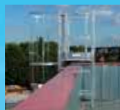
Passage d'acrotère avec redescente