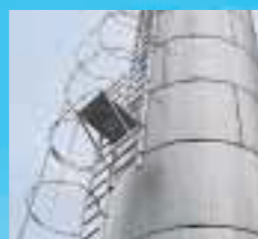
Changement de volée