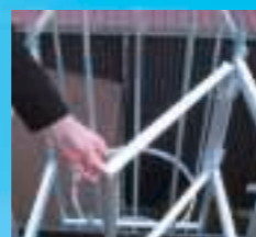
Portillon de sécurité haut, à rappel automatique