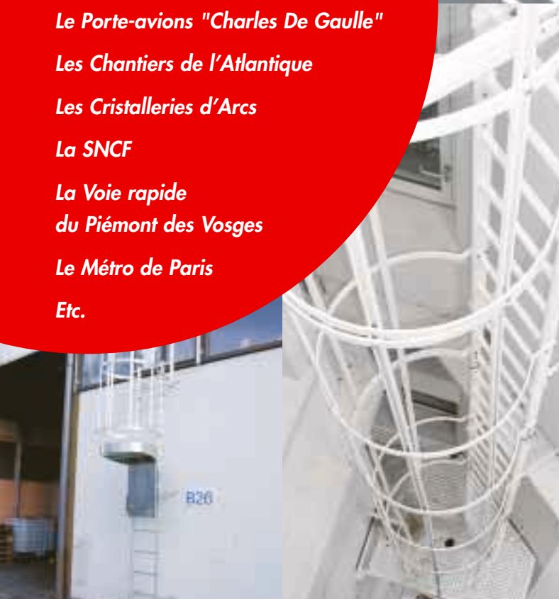
Condamnation AC 610 - différents modèles sur demande.