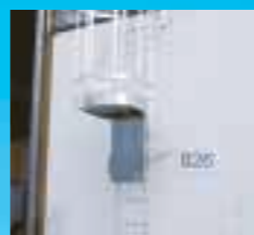
Condamnation basse, différents modèles sur demande.