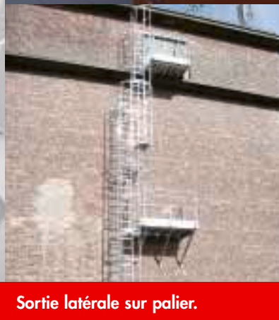
Sortie latérale sur palier.