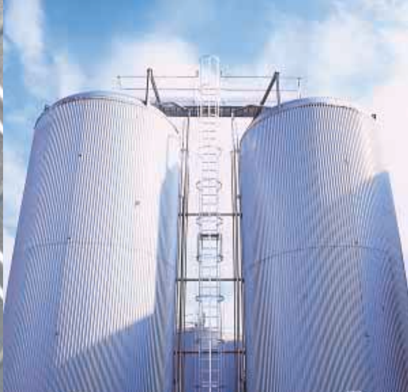
Accès passerelle sur cuve.