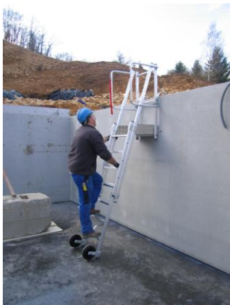
Accès à la PAP