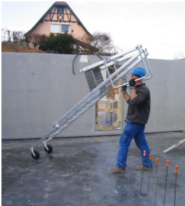
Présentation de la PAP sur la banche