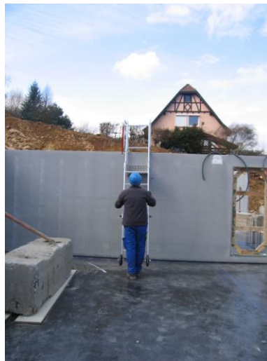
Accrochage de la PAP à la banche