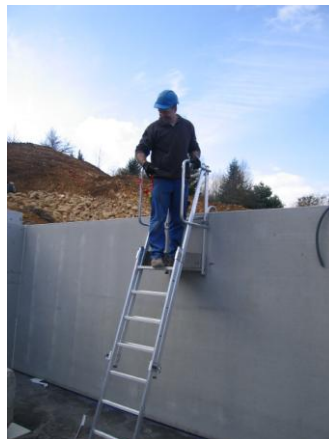
Accrocher la sangle